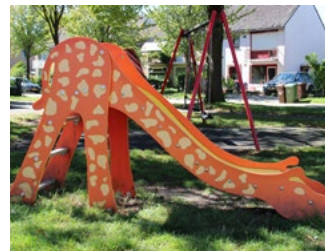
5 Subsidies en tegemoetkomingen