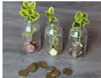
2 Gebruikelijk loon en vrijwilligersvergoeding