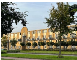
7 Varia arbeidsrecht en sociaal zekerheidsrecht