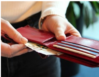
1 Tarieven loonbelasting, premies, heffingskortingen en varia

Deze special bevat actuele cijfers en relevante wet- en regelgeving op onder meer het gebied van de loonbelasting, het gebruikelijk loon, de auto van de zaak, de WKR, subsidies voor de werkgever, diverse arbeidsrechtelijke zaken en pensioenen. Aan het einde van dit document is een aantal tabellen met cijfers en tarieven voor 2026 opgenomen.